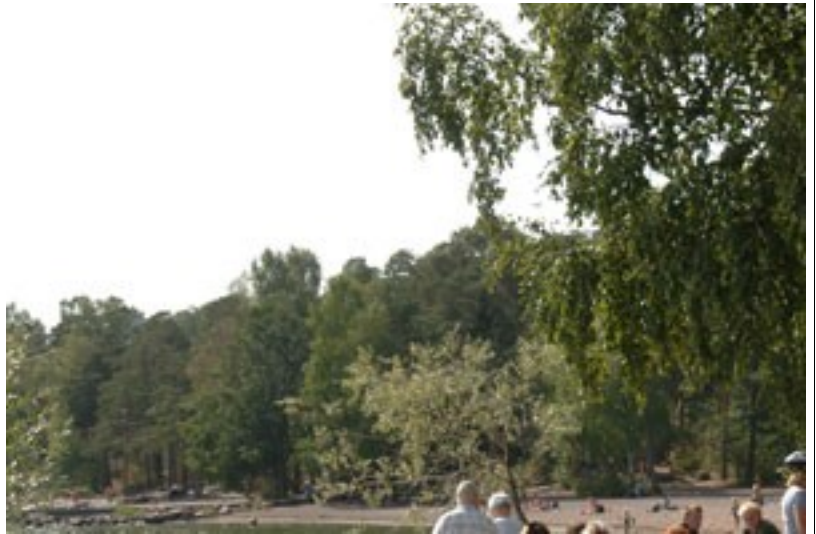
Näkymä kesäravintolasta uimarannalle