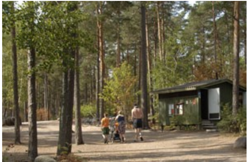
Pukuhuoneet ja wc:t